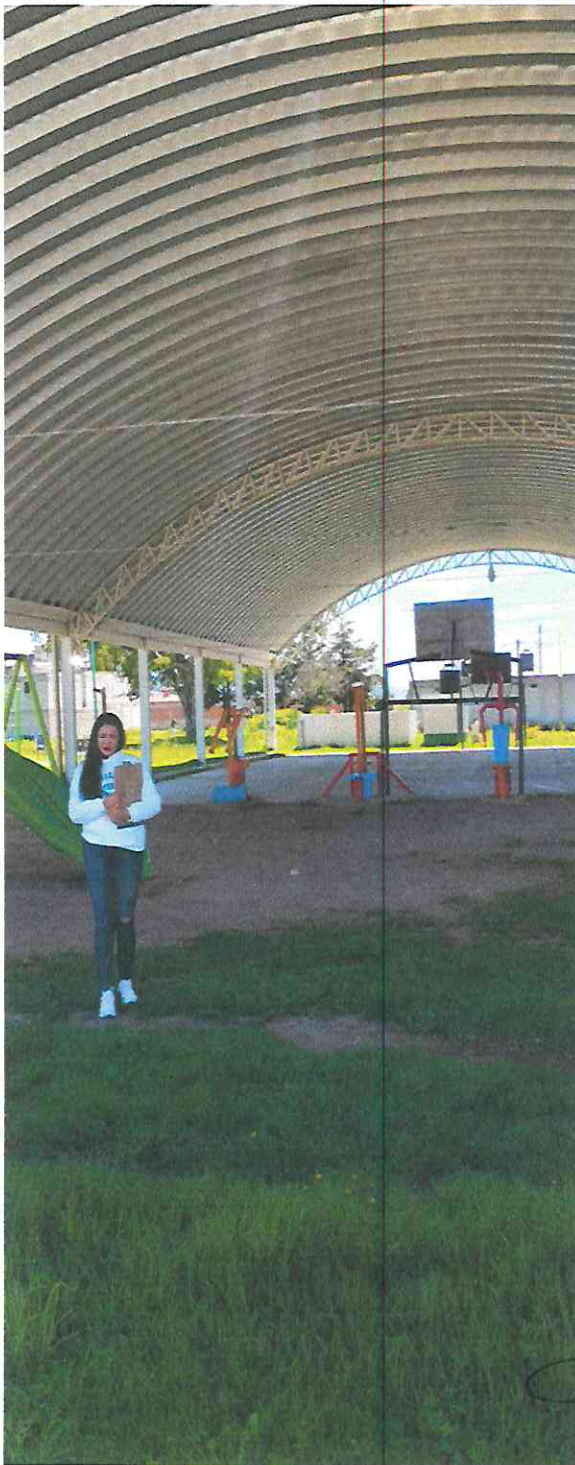
INSTALACIONES DE CANCHAS MULTIUSOS