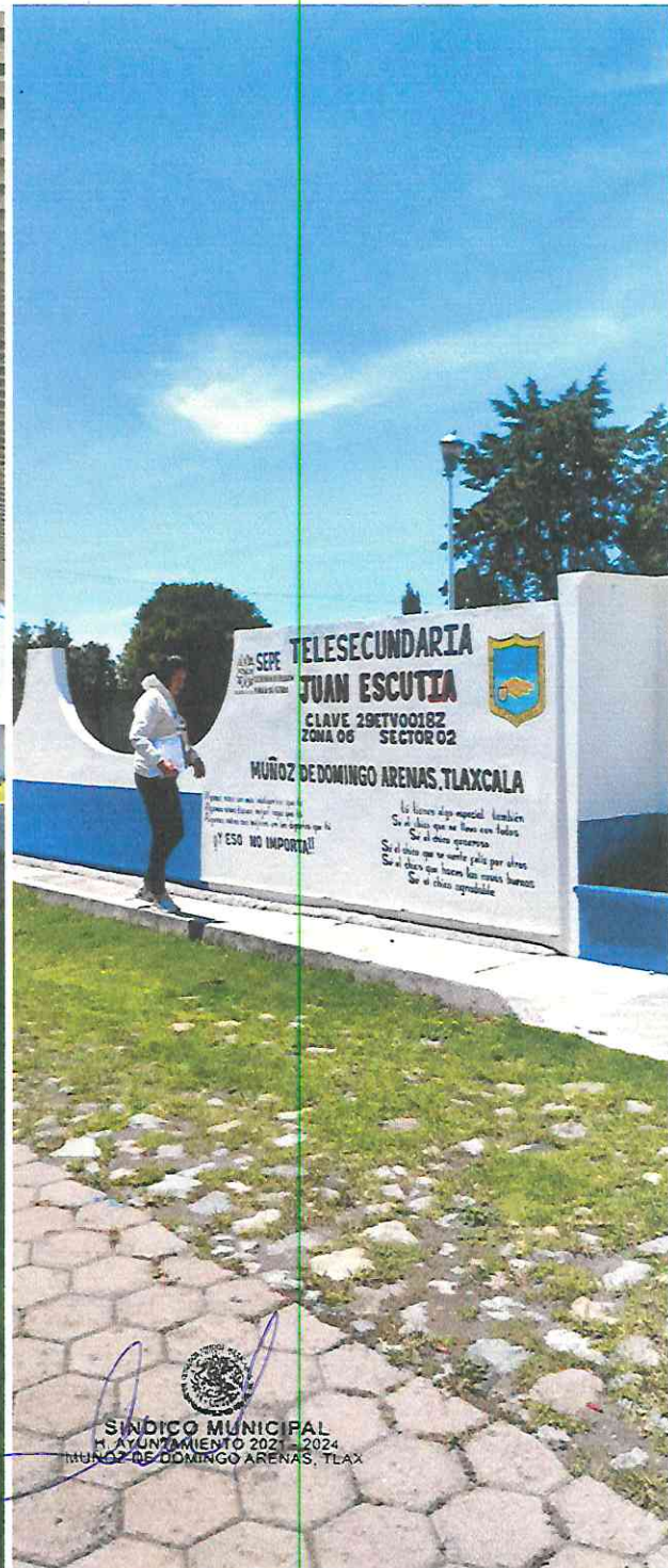
INSTALACIONES DE ESCUELAS MUNICIPALES